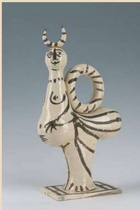
PICASSO, Faunesse, 1950