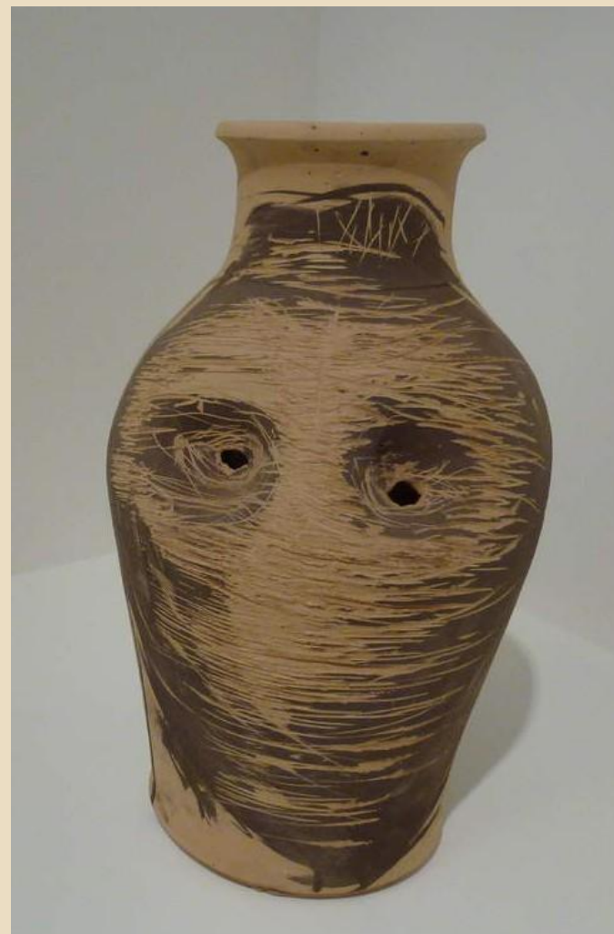
BARCELO, Autoportraits, 2011