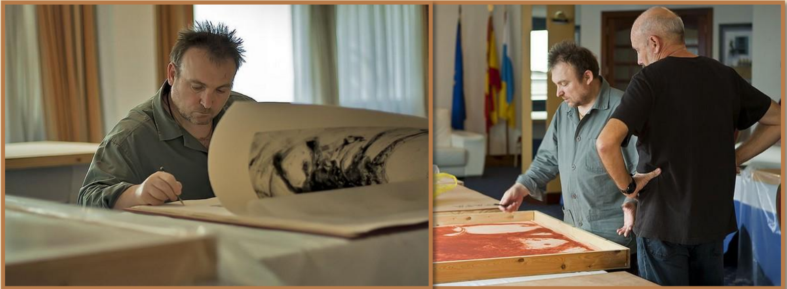
Miquel Barcelo, 2011

" Les artistes avant de réaliser leur œuvre définitive s'engagent dans des recherches. C'est ce que nous allons faire. "