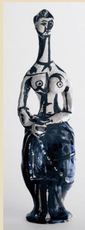
PICASSO, Femme aux mains jointes, 1950