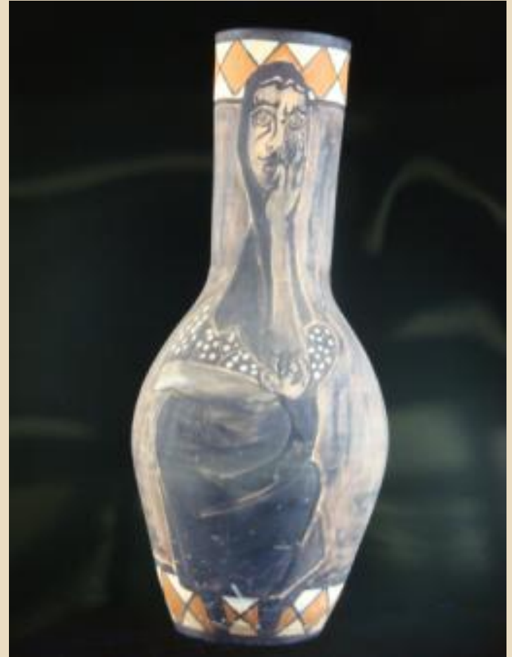
Edouard PIGNON, Catalane, 1953