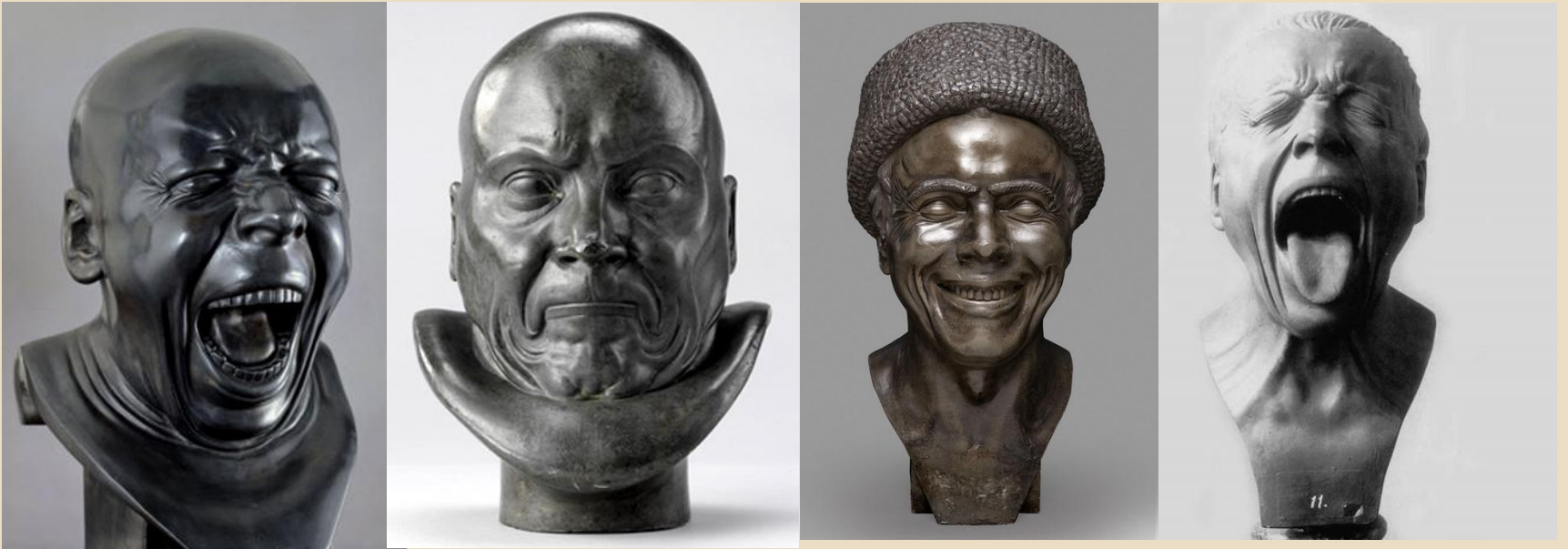
Messerschmidt (1774 à 1783)