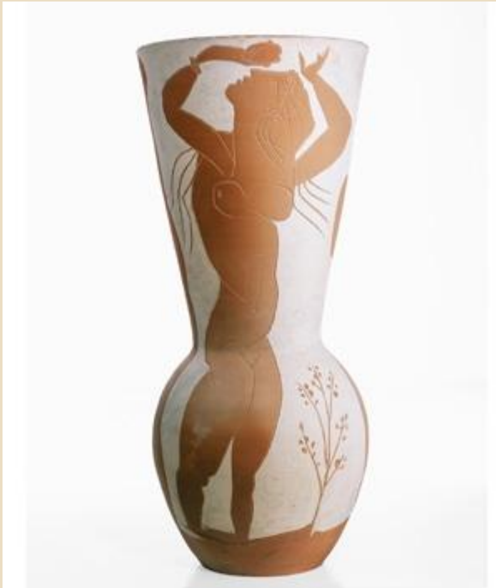
PICASSO, Vase aux danseuses, 1950