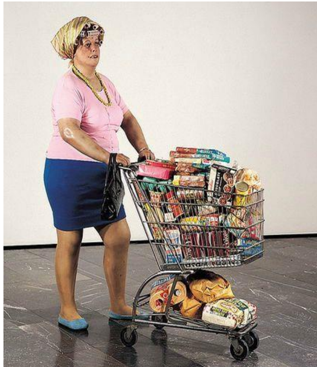
Ludwig Forum -Aix La Chapelle

Sculpture hyperréaliste (plâtre, polyester et fibres de verre peinte).