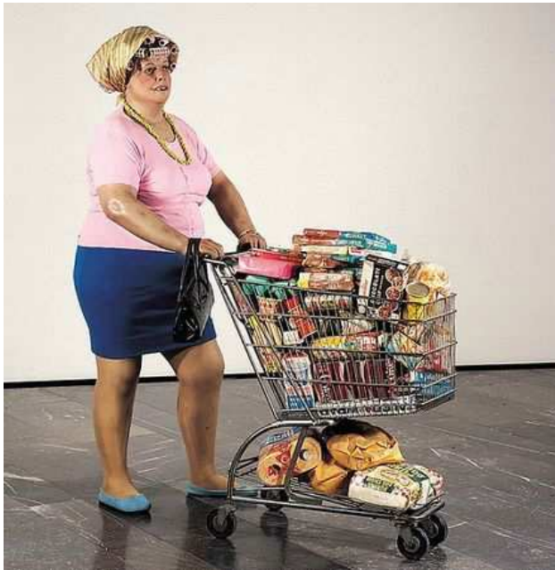
Lady supermarket-Duane Hanson