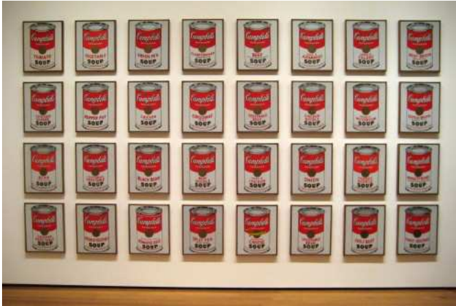
Soupe Campbell-Andy Warhol