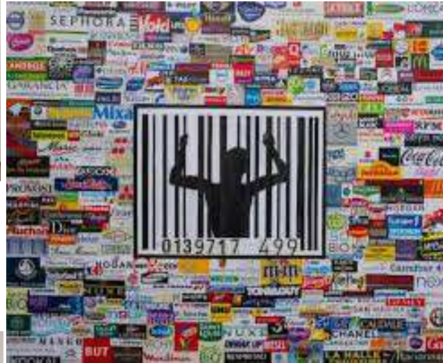
Fils de pub-