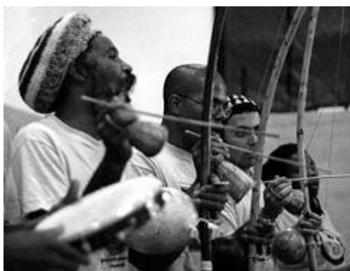
Berimbau et Pandeiro

Dans une roda on retrouve les instruments traditionnels suivants : Berimbau ; pandeiro, atabaque, agogo