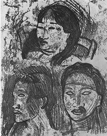
Paul GAUGUIN Trois têtes de Tahitiens

De 1876 à 1886, DEGAS utilise souvent une technique d'estampage, appelée monotype ; pour cette œuvre en particulier, il emploie un procédé rare en superposant le pastel au monotype dont l'encre noire accentue les zones de pénombre.