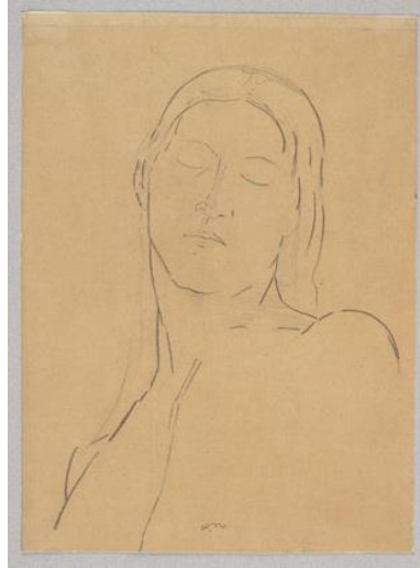
Odilon REDON Les yeux clos 1890