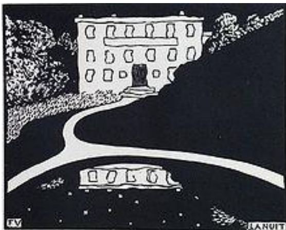
Vallotton La nuit Gravure sur bois 1896