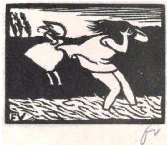
Vallotton Baigneuses surprises par l'orage 1893