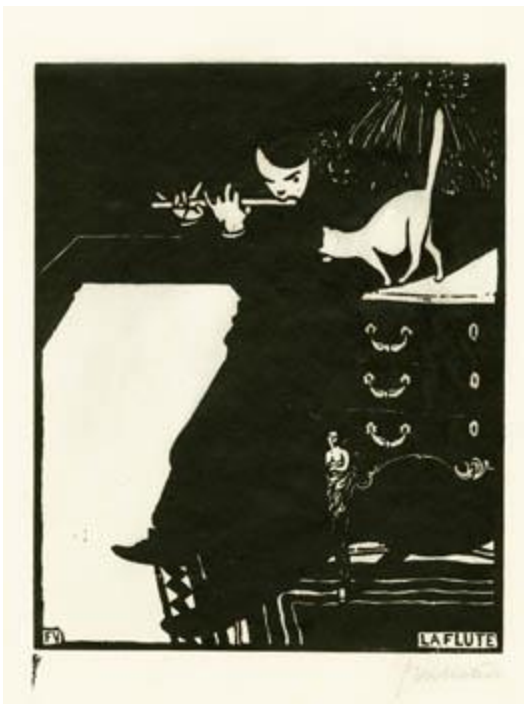
Vallotton Les instruments de musique , La Flûte , 1896. Xylographie

Dès 1891, il commence à produire de nombreuses images montrant, la société contemporaine, la vie urbaine, d'une manière plutôt cynique. Ses gravures prennent une forme nouvelle et moderne. Le groupe des Nabis reconnaît dans les gravures de Vallotton ses principes picturaux. Son ami Edouard Vuillard l'introduit auprès des membres de la Revue blanche , la revue des Nabis, dans laquelle il publiera ses gravures. Il y écrit également des articles.