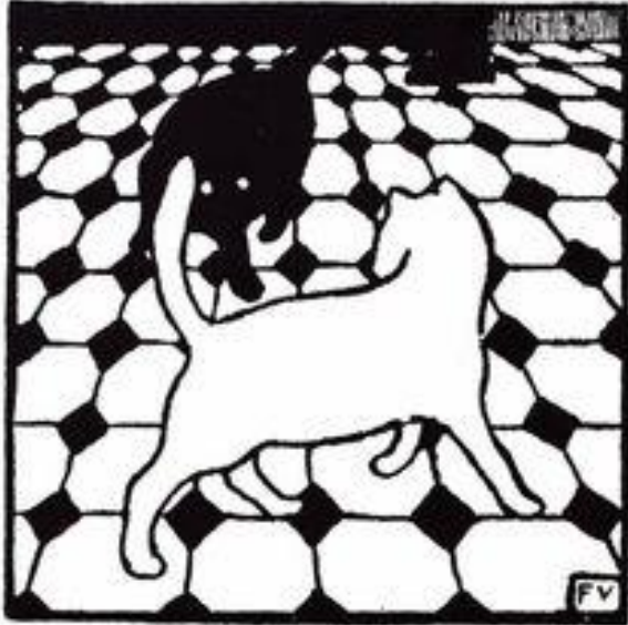
Vallotton Deux chats 1895