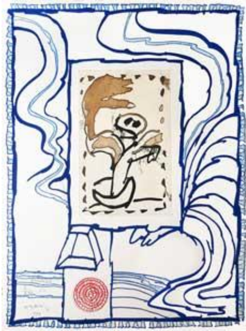
Gravure en couleurs 1994

Tour à tour peintre, graveur, écrivain, Pierre Alechinsky est un homme qui aime jeter des passerelles entre les langages et les modes d'expression. La peinture, le dessin sont des activités solitaires. Le livre ou l'estampe se font à plusieurs, créant des liens avec des écrivains.