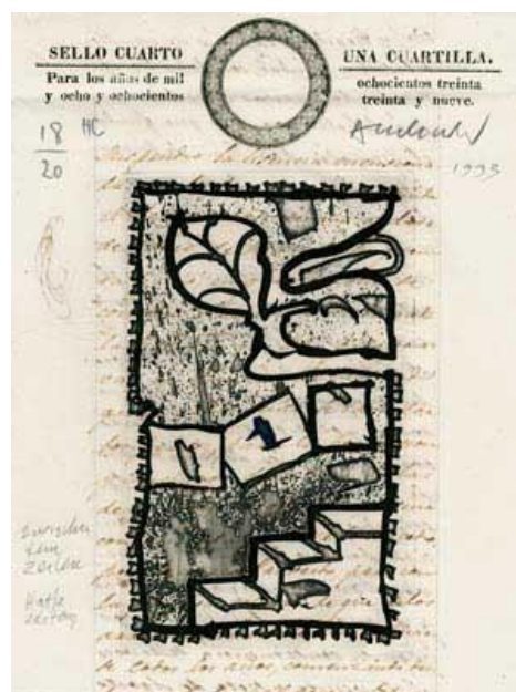
Gravure sur manuscrit ancien 1993