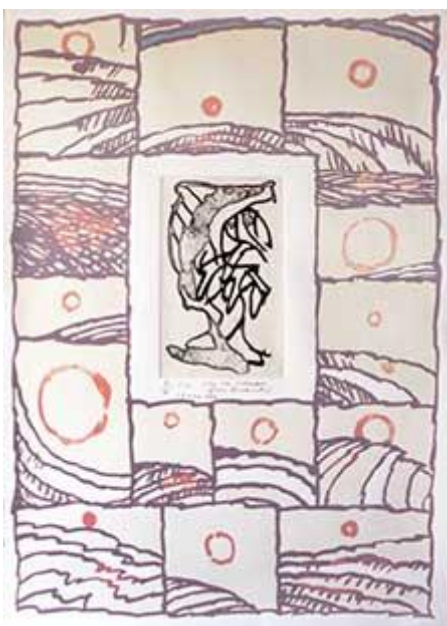
Gravure et lithographie 1987