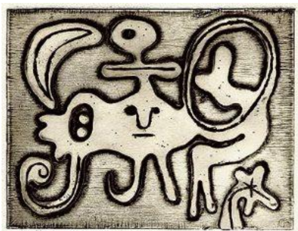
Femme et oiseau devant la lune 1947