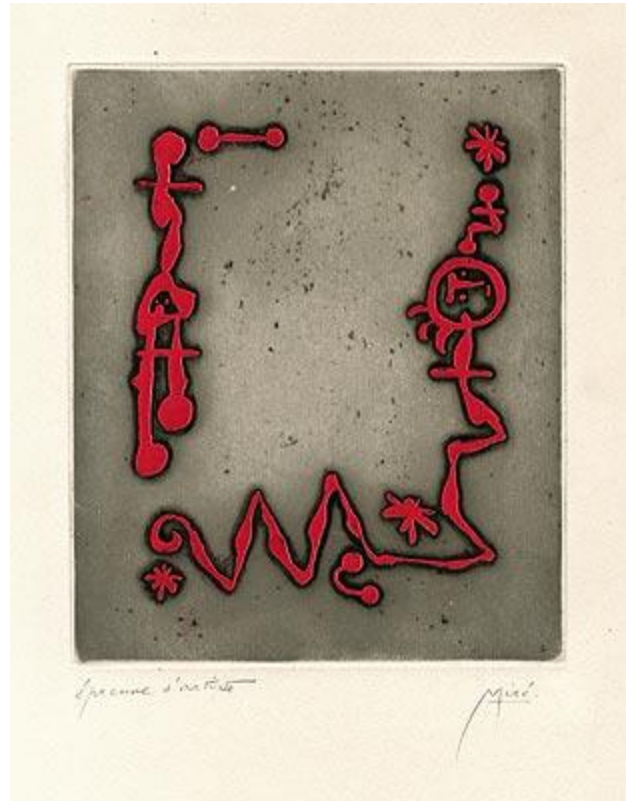
Eau forte vers 1950