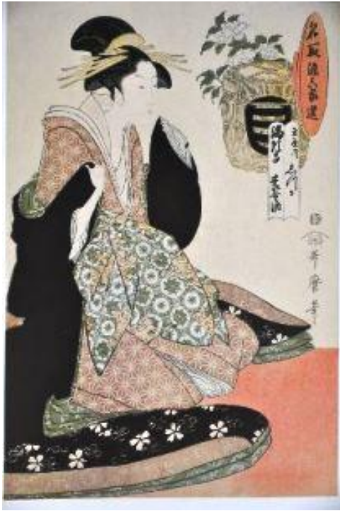
Utamaro La courtisane Shizuka 1794