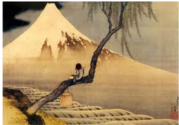
Joueur de flûte et mont Fuji 1839