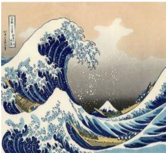
La grande vague de Kanagawa 1831