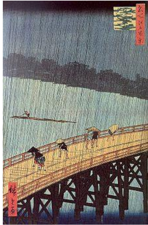
Hiroshige Le pont Ohashi sous l'averse 1857