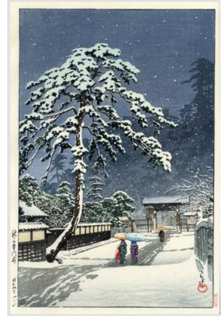
Hasui KAWASE (1883-1957) Temple Honmonji sous la neige 1931 (HK39) Estampe Shin hanga