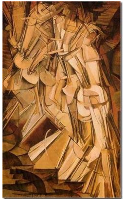
Marcel Duchamp Nu descendant les escaliers 1912