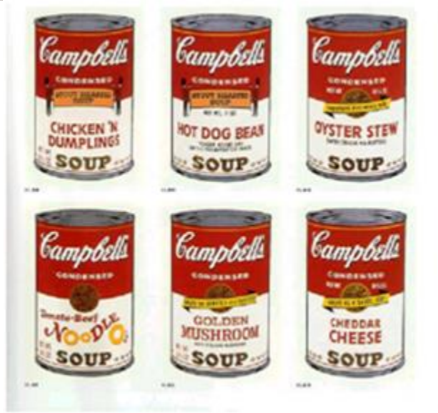
Andy Warhol, Campbell's soup cans 1968 – sérigraphie