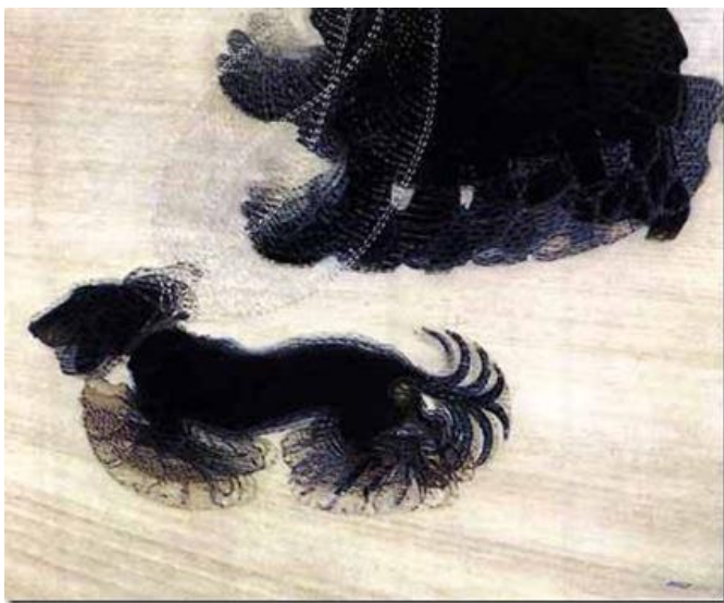
Giacomo. Balla Effets dynamiques d'un chien en laisse 1912