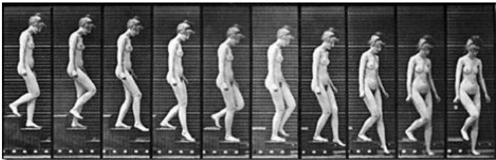
Edward-Muybridge Nu descendant un escalier 1887