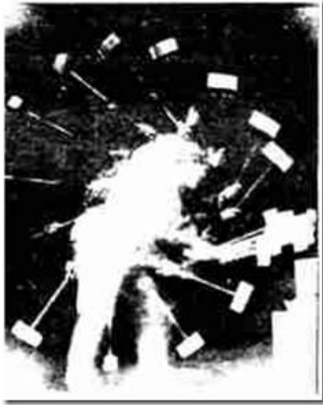
Marey Le coup de marteau , chronophotographie sur plaque fixe, 1895.