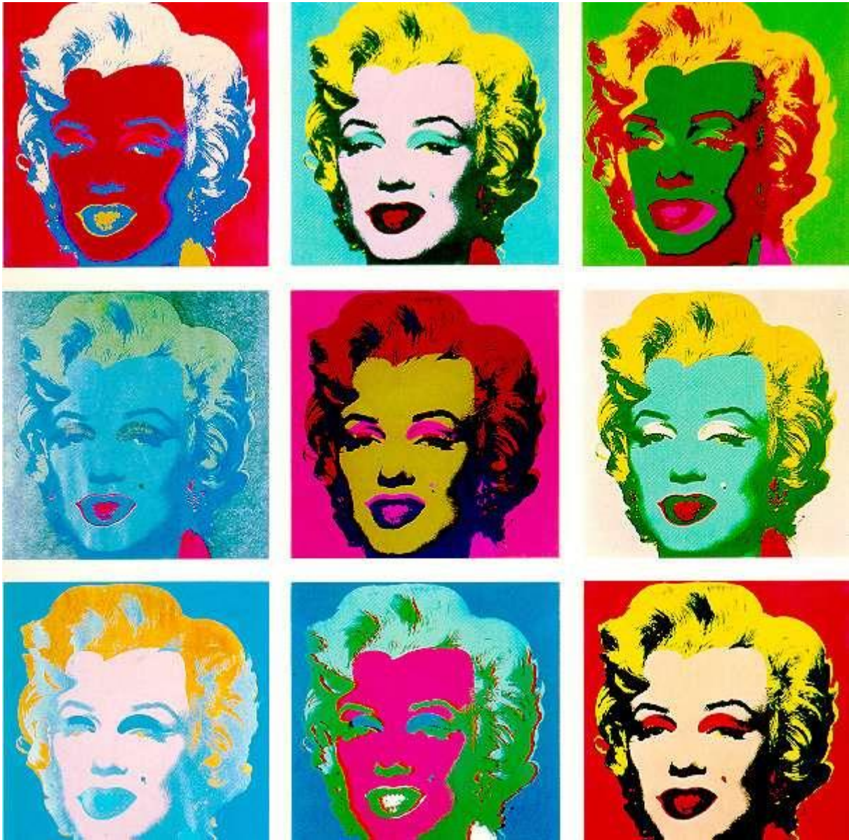
Andy Warhol Marilyn Monroe 1967

http://e-cours-arts-plastiques.com/les-procedes-repetitifs-dans-lart/