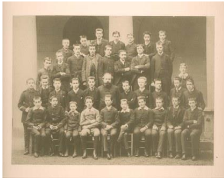
Photo de classe Condorcet 1887

Dès les premières décennies de son histoire, la photographie explore déjà pour ainsi dire la totalité des sous-genres du portrait que nous pratiquons encore actuellement : des portraits officiels commandés par les puissants de ce monde au nu, en passant par les images de célébrités artistiques ou intellectuelles, le portrait social , le portrait documentaire , le portrait "scientifique" , le portrait familial – et notamment le portrait de mariage et les portraits d'enfants –, l' autoportrait , le portrait de groupe , le portrait historisant , le portrait fictif ... L'évolution ultérieure ne fera que reconduire cette place importante du portrait : il sera de tout temps un des usages sociaux majeurs de la photographie .