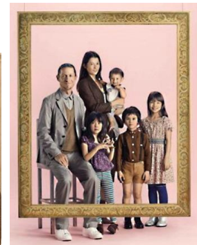
Publicité Uniqlo 2013