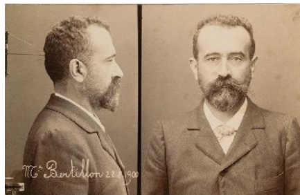
Bertillon Autoportrait 1900