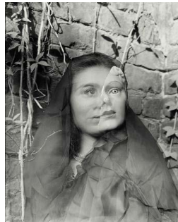
Laughlin Le masque 1947