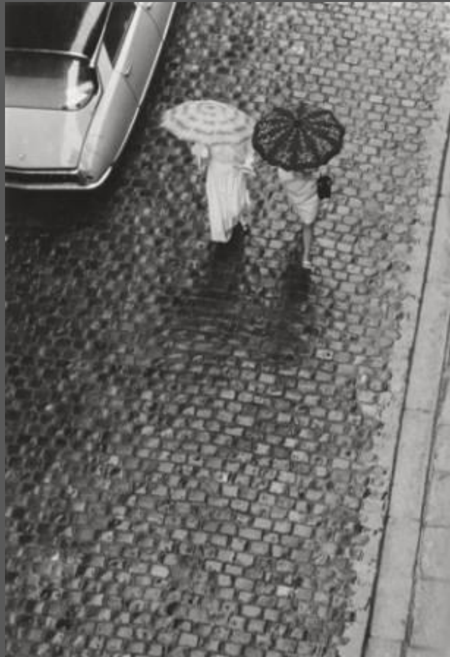
Vue en plongée