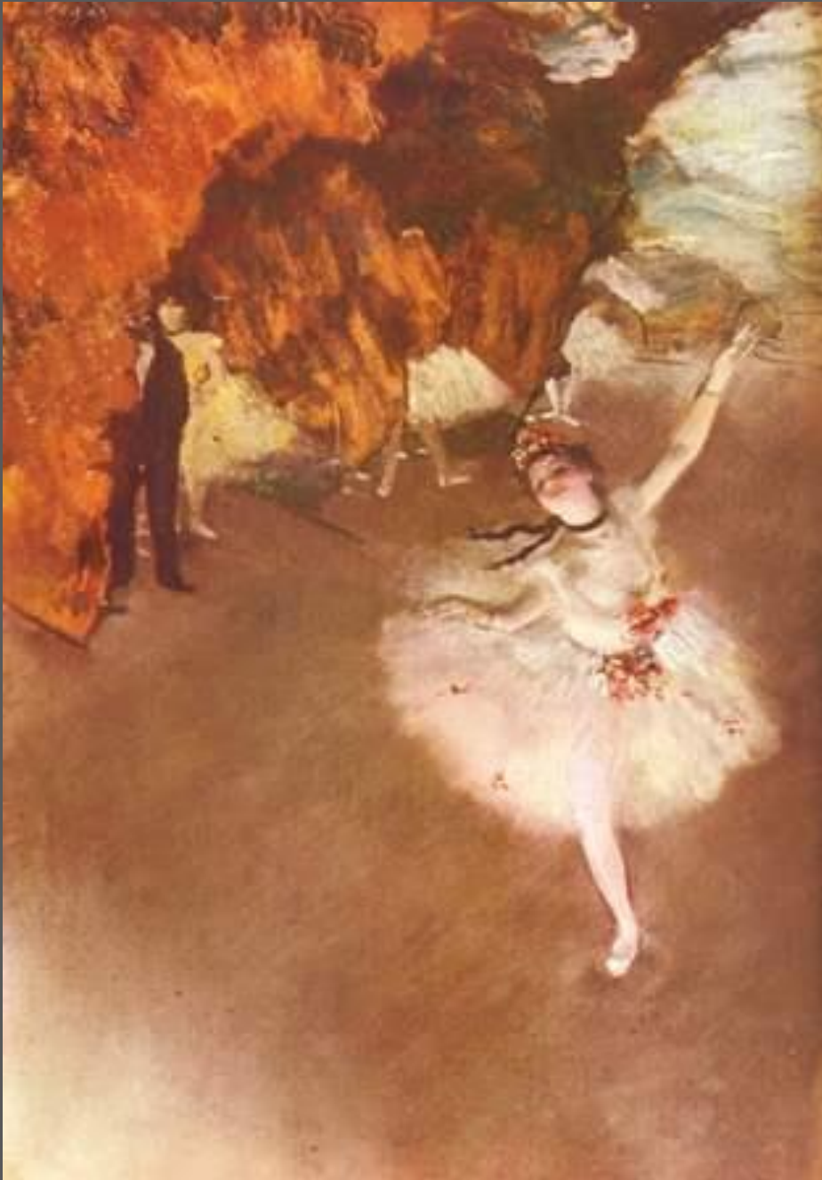
Degas L'étoile 1878