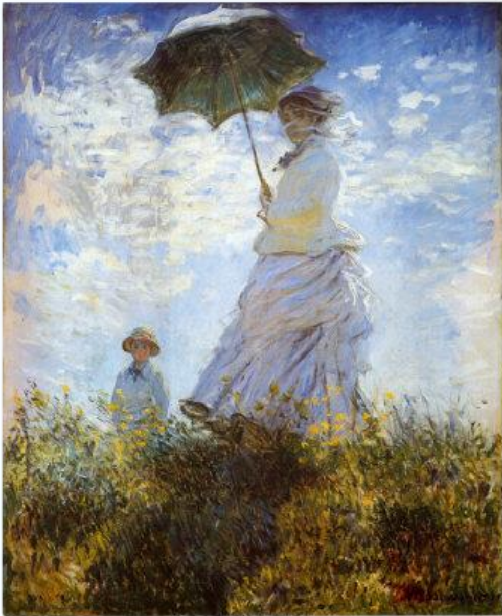
Monet La promenade 1875