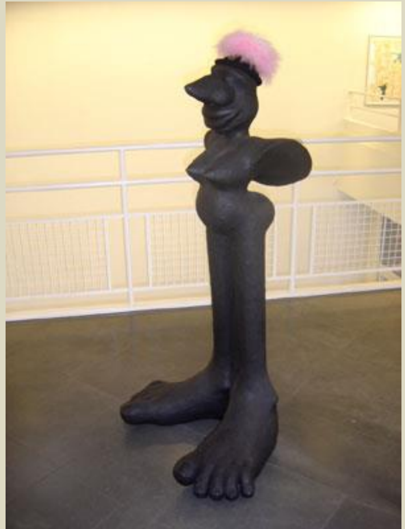
La belle des bennes 2004