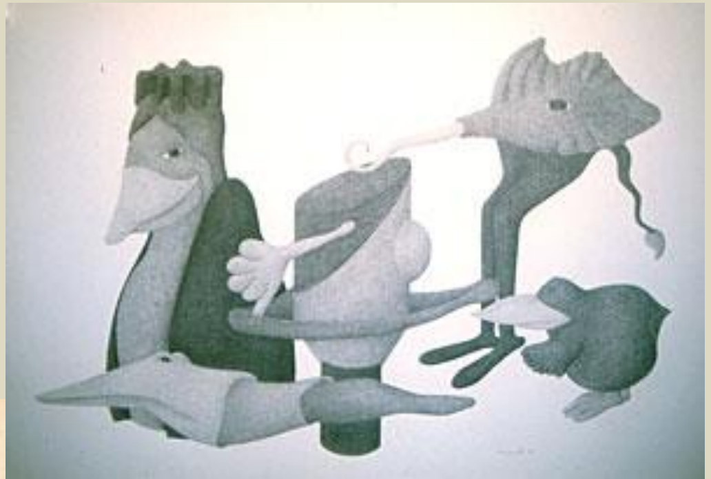
Sans titre 1989 Mine de plomb sur papier