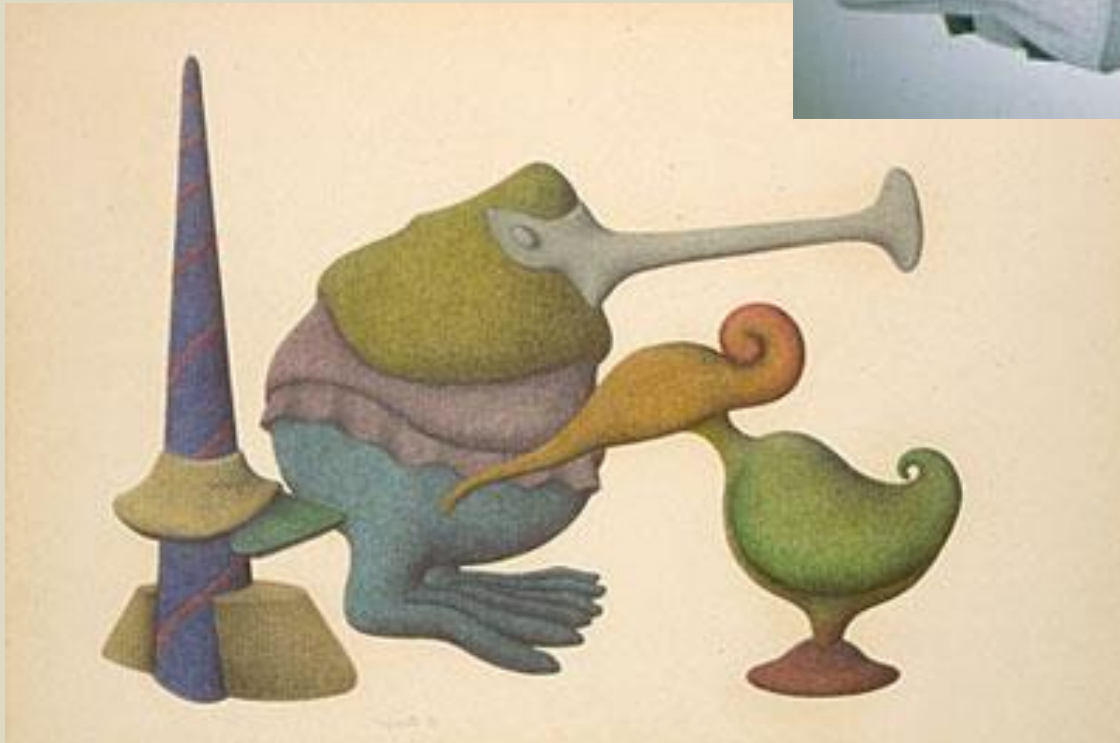
Sans titre 1989 Crayons de couleur et mine de plomb