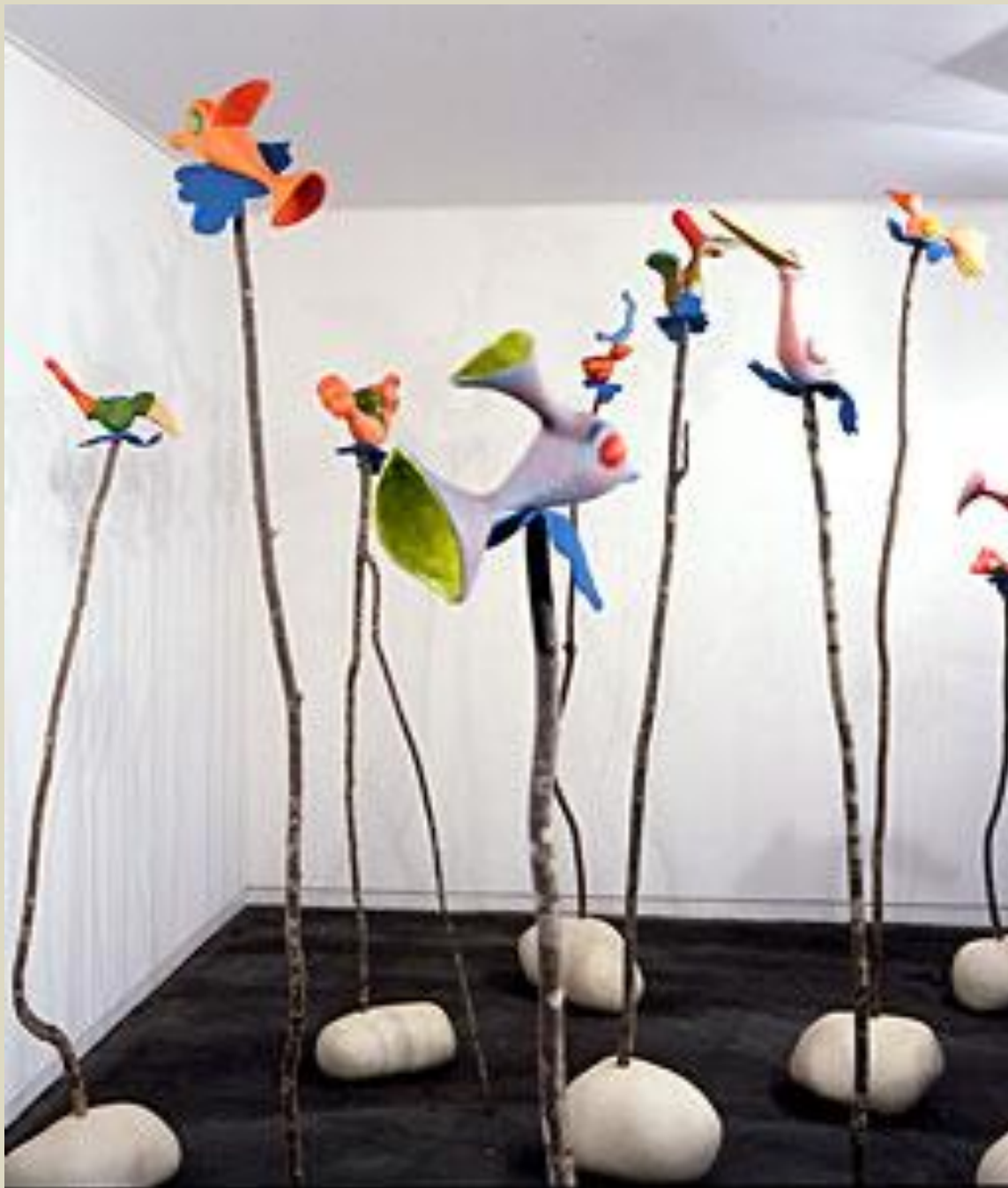
Sommets 1996 Bois, pâte à papier, plâtre, hauteur 1,20 à 2,30 m