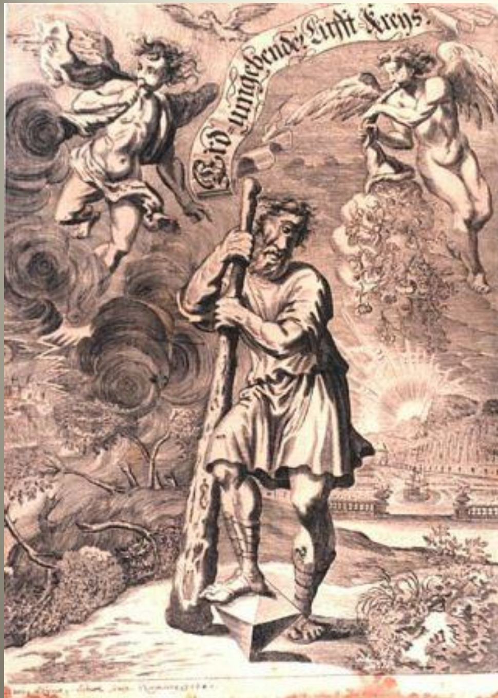
Cyclope Illustration 1680