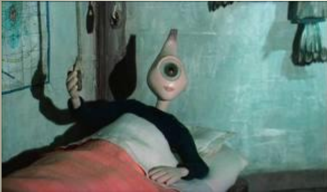
Images du film Le cyclope de la mer