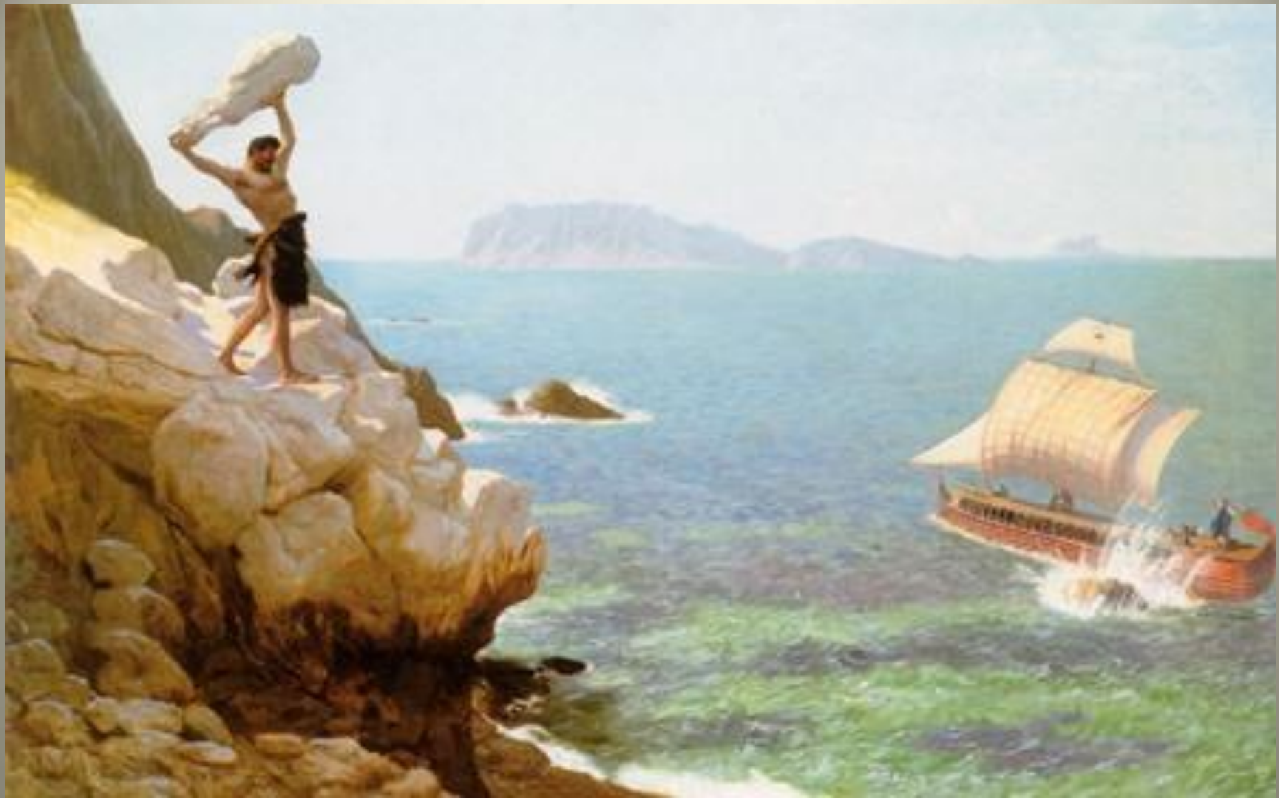
Jean Léon Gérôme Polyphème et Ulysse