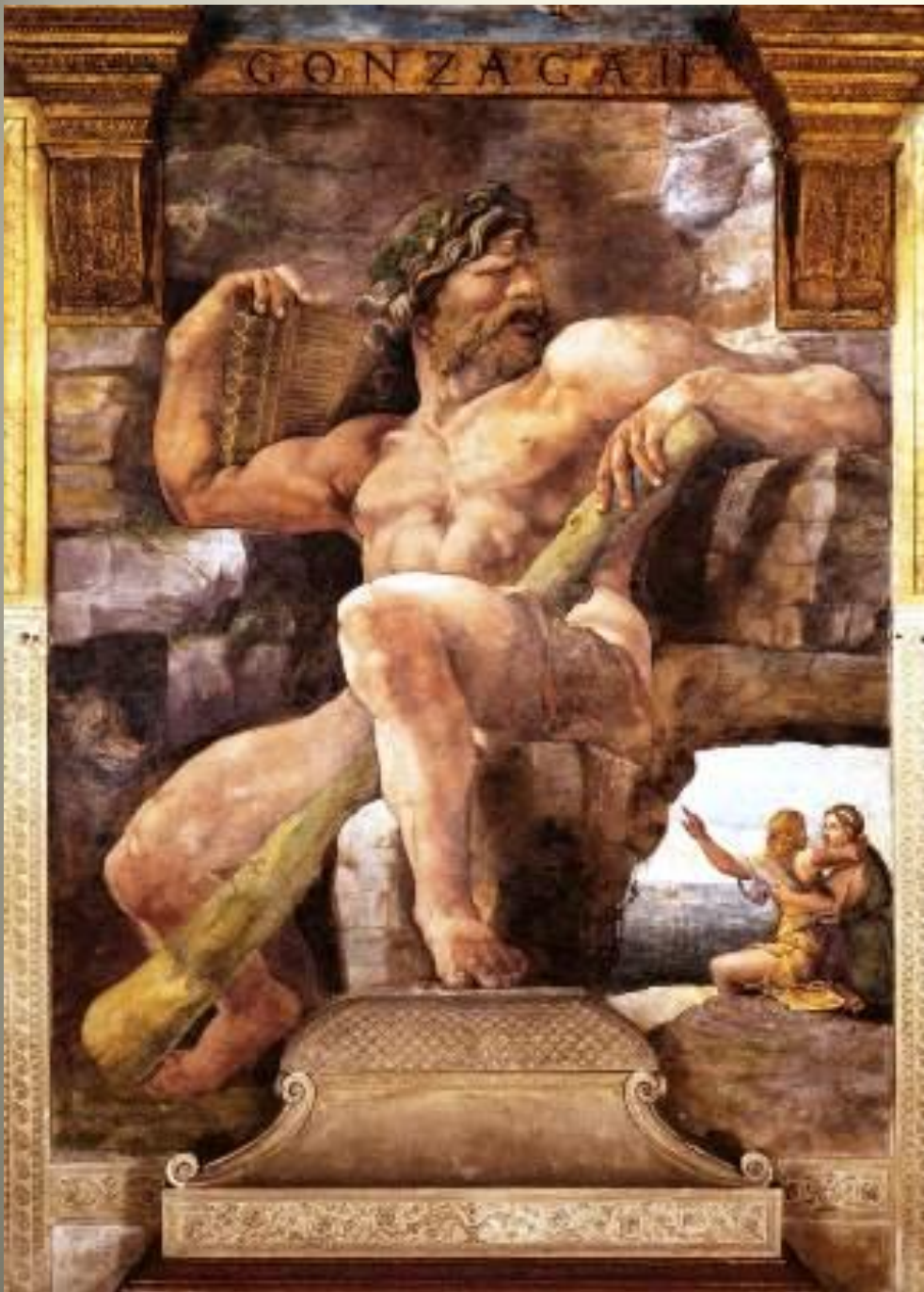
Giulio Romano Polyphème