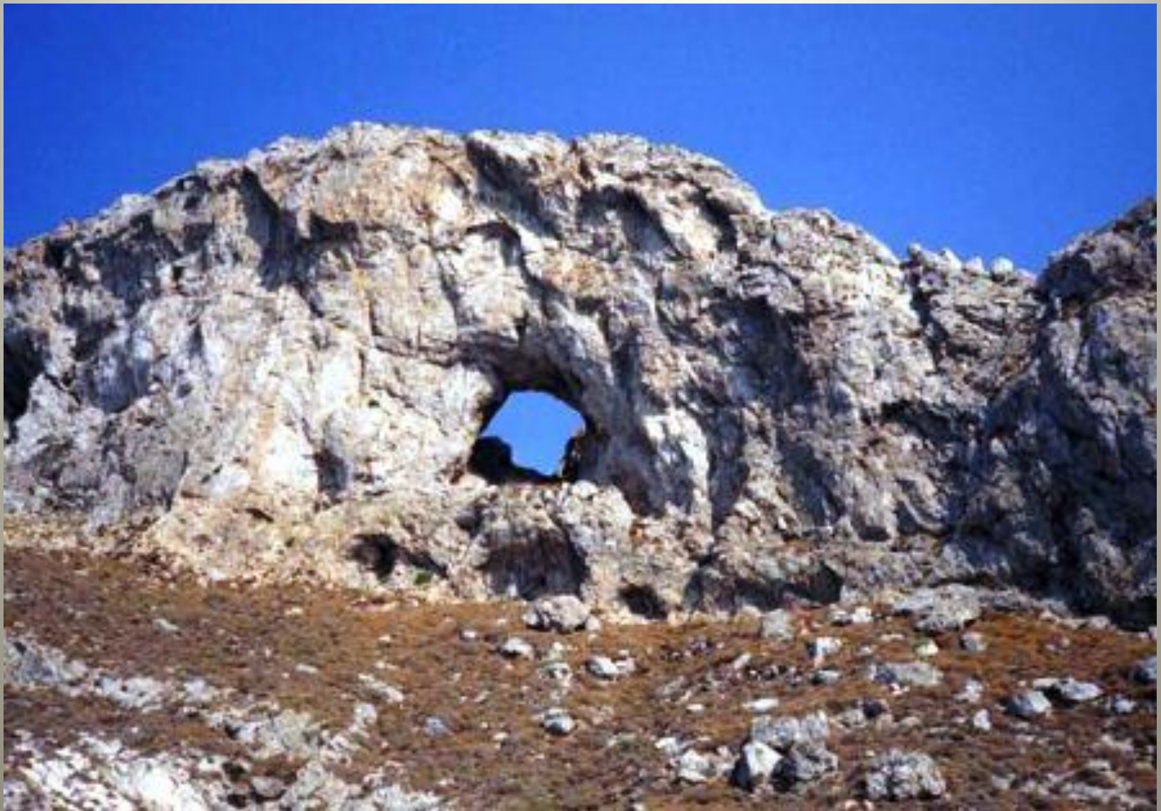
L'œil du Cyclope, île de Gioura, Grèce