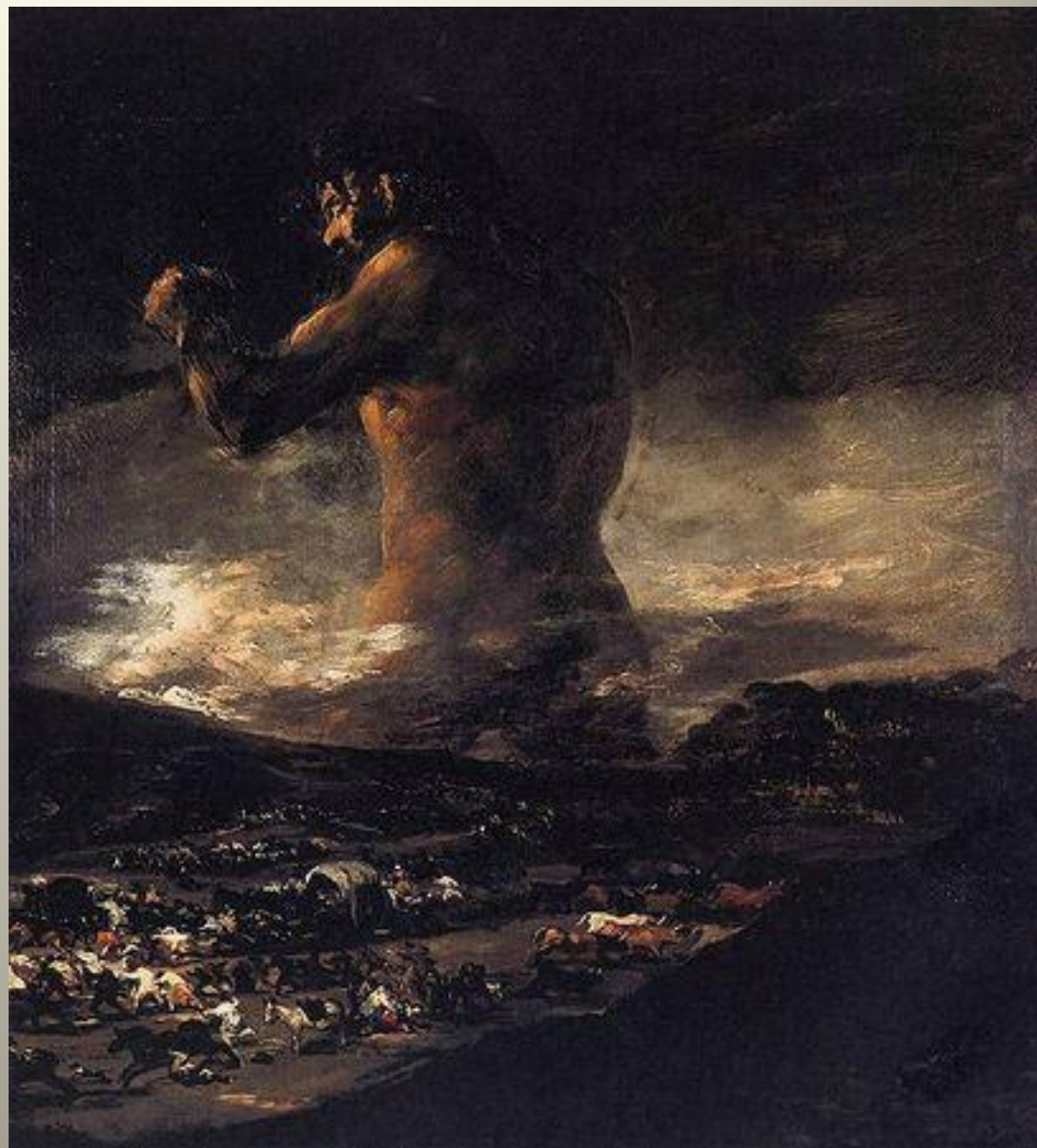
Goya 1812 Le colosse