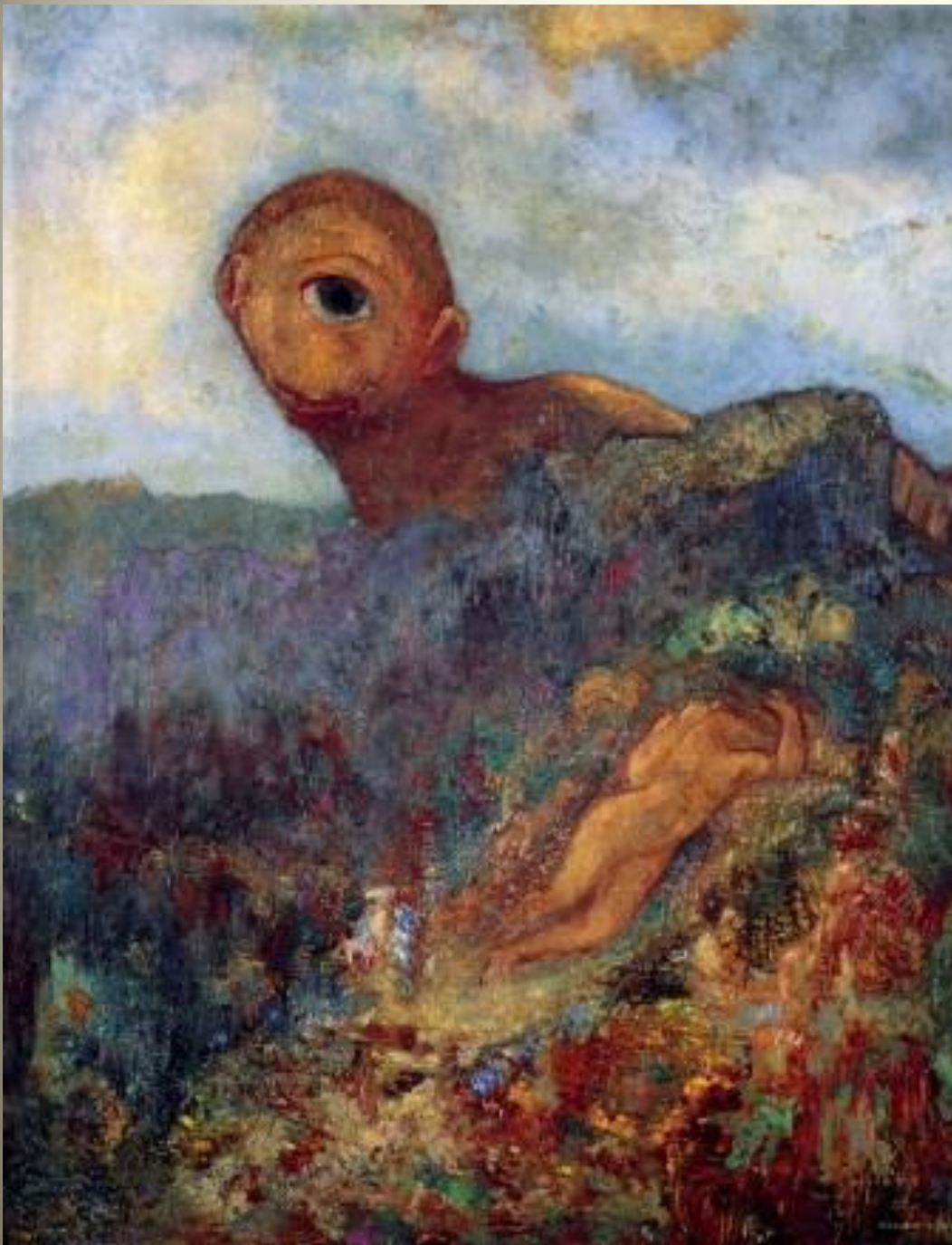
Odilon Redon 1914 Le cyclope