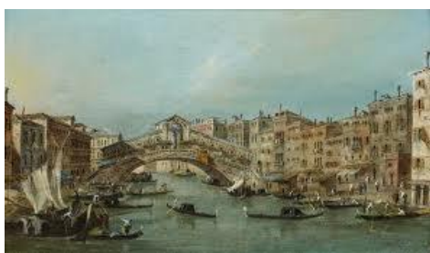
Francesco GUARDI Le pont du Rialto

Palettes italiennes : étude d'une veduta Musée des Augustins de Toulouse http://www.edu.augustins.org/pdf/second/ital/ietu03s.pdf