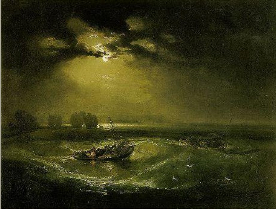
TURNER Pêcheurs en mer 1796