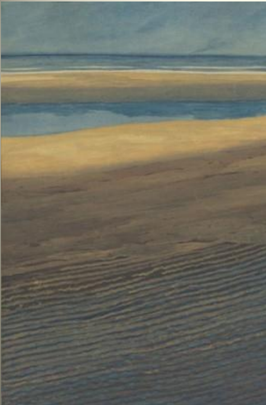
SPILLIAERT Marée basse 1909