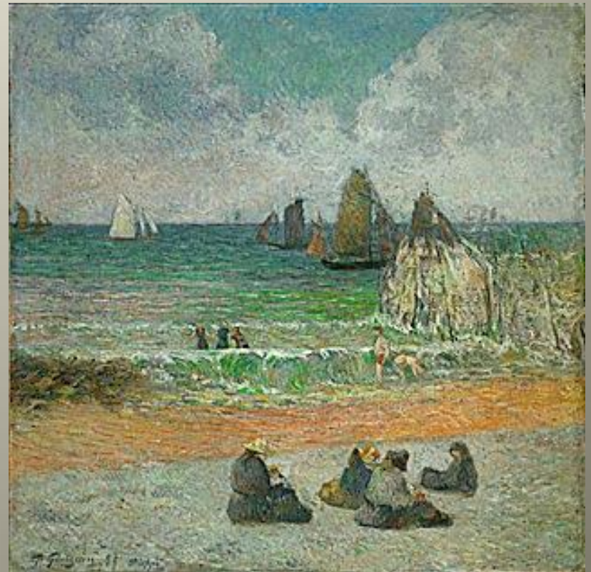
GAUGUIN La plage de Dieppe 1885