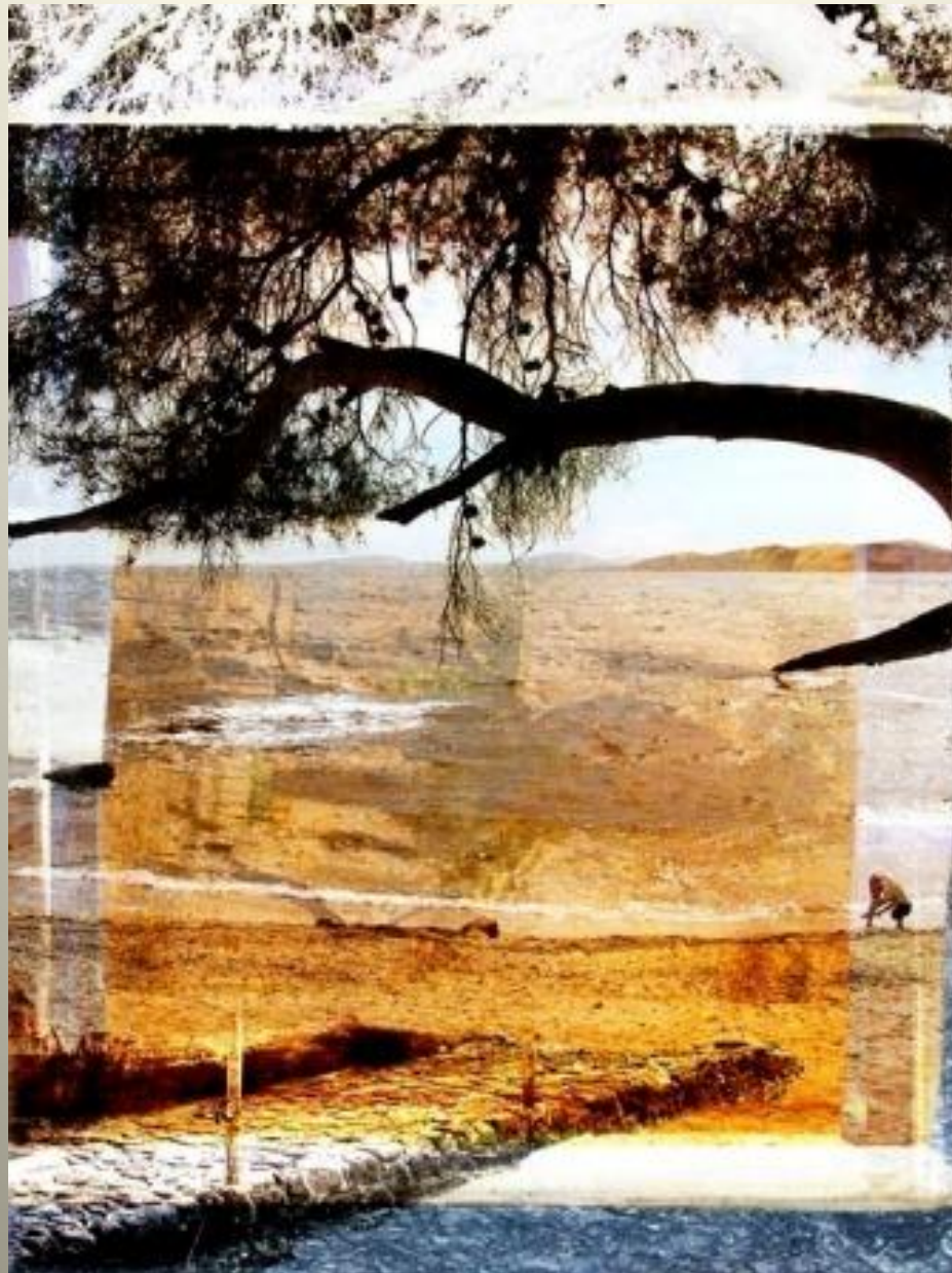
Christophe KEIME Bord de mer