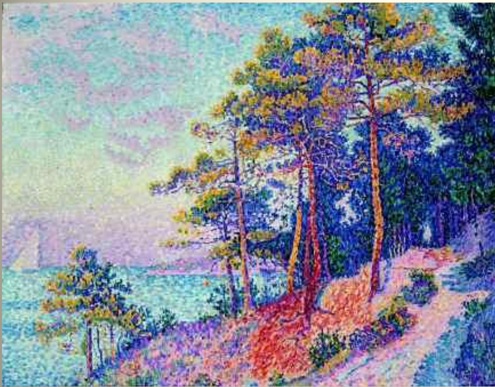
SIGNAC Bord de mer