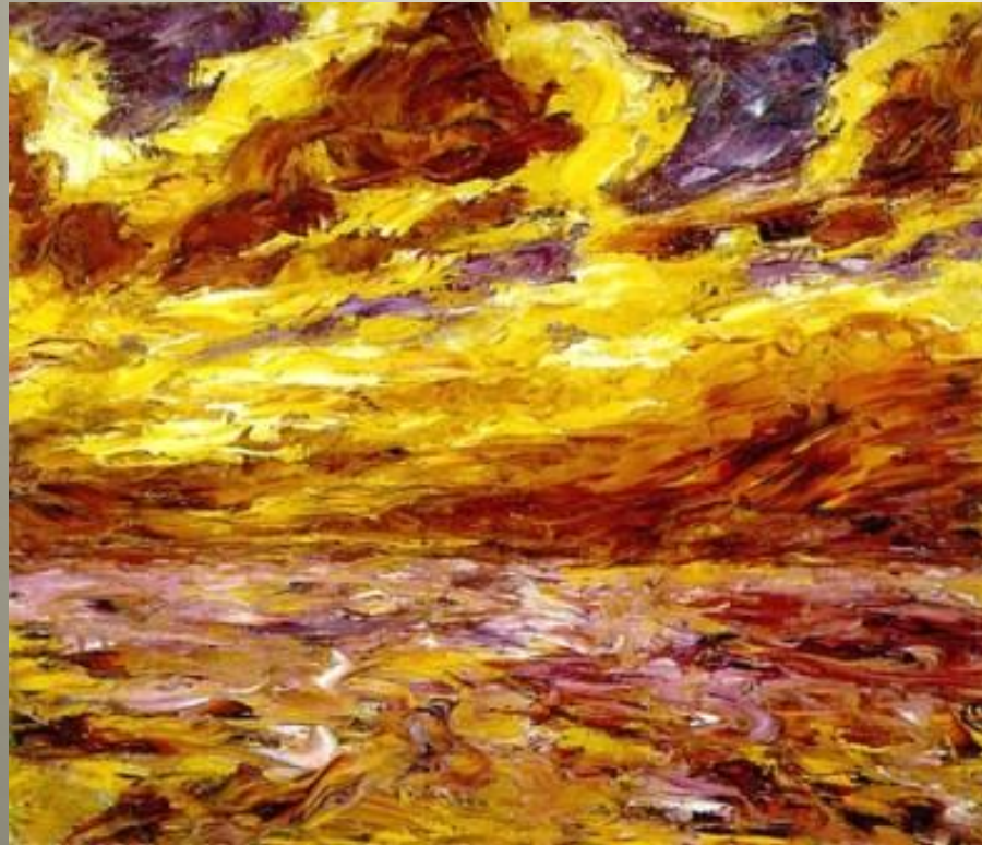
NOLDE Mer en automne 1910