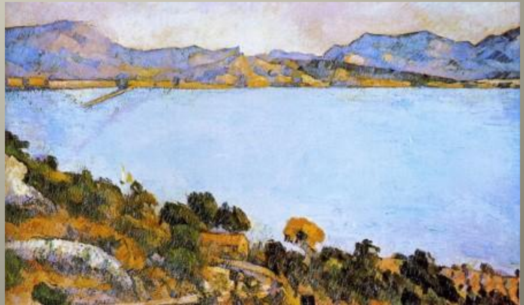
CEZANNE La mer à l'Estaque