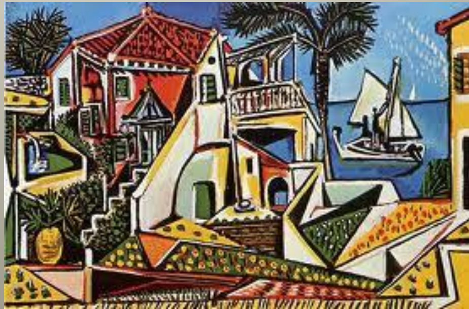
PICASSO Paysage méditerranéen 1952