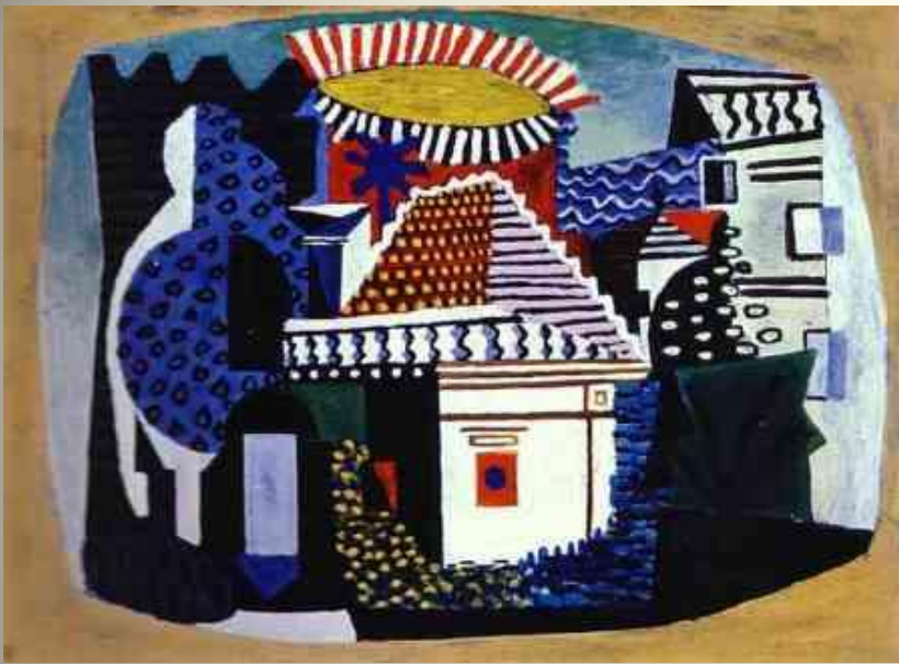
PICASSO Juan les Pins 1920