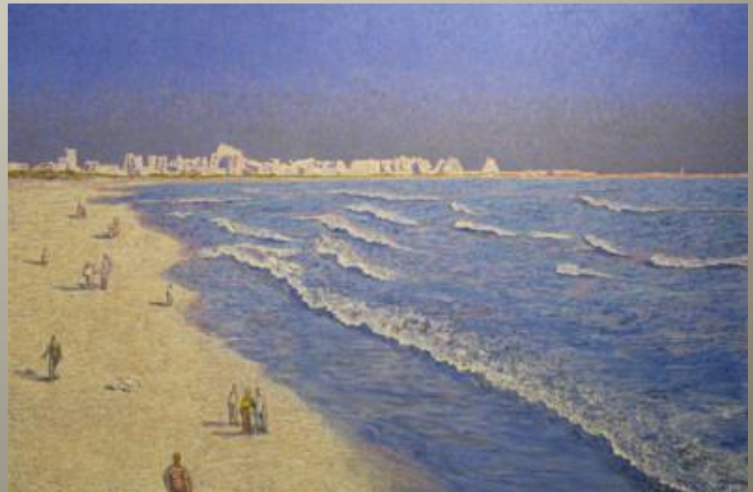
Le Grand Travers 2004