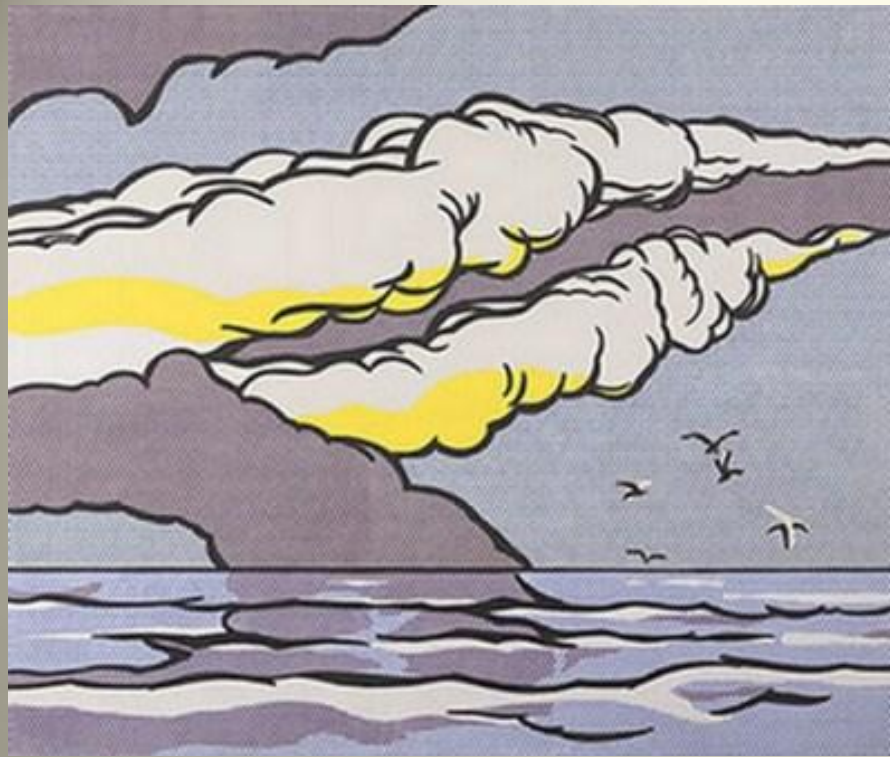
LICHTENSTEIN Gullscape 1964