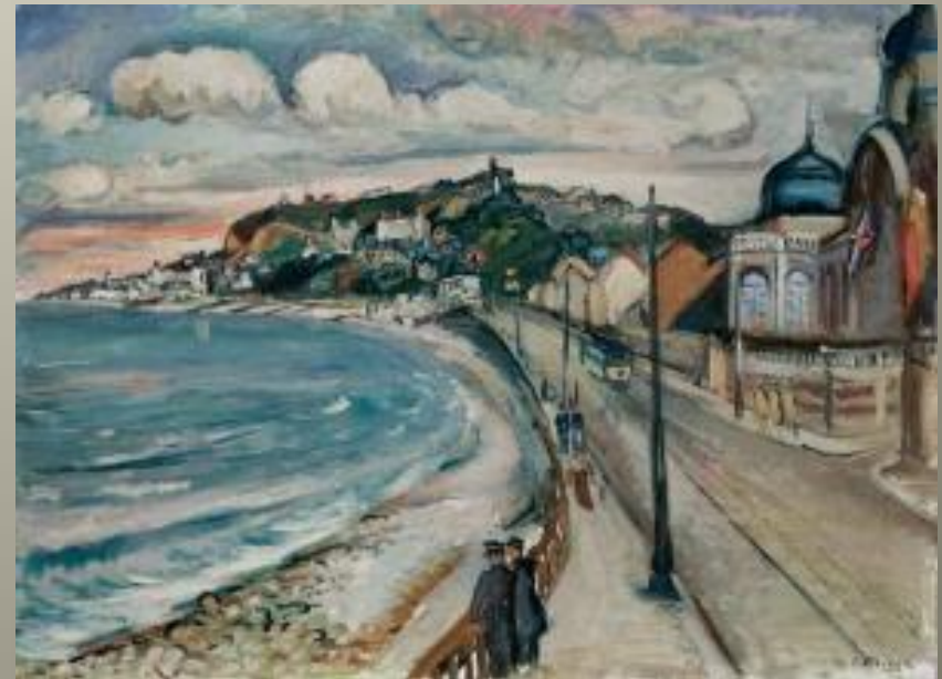
Bord de mer à Sainte Adresse