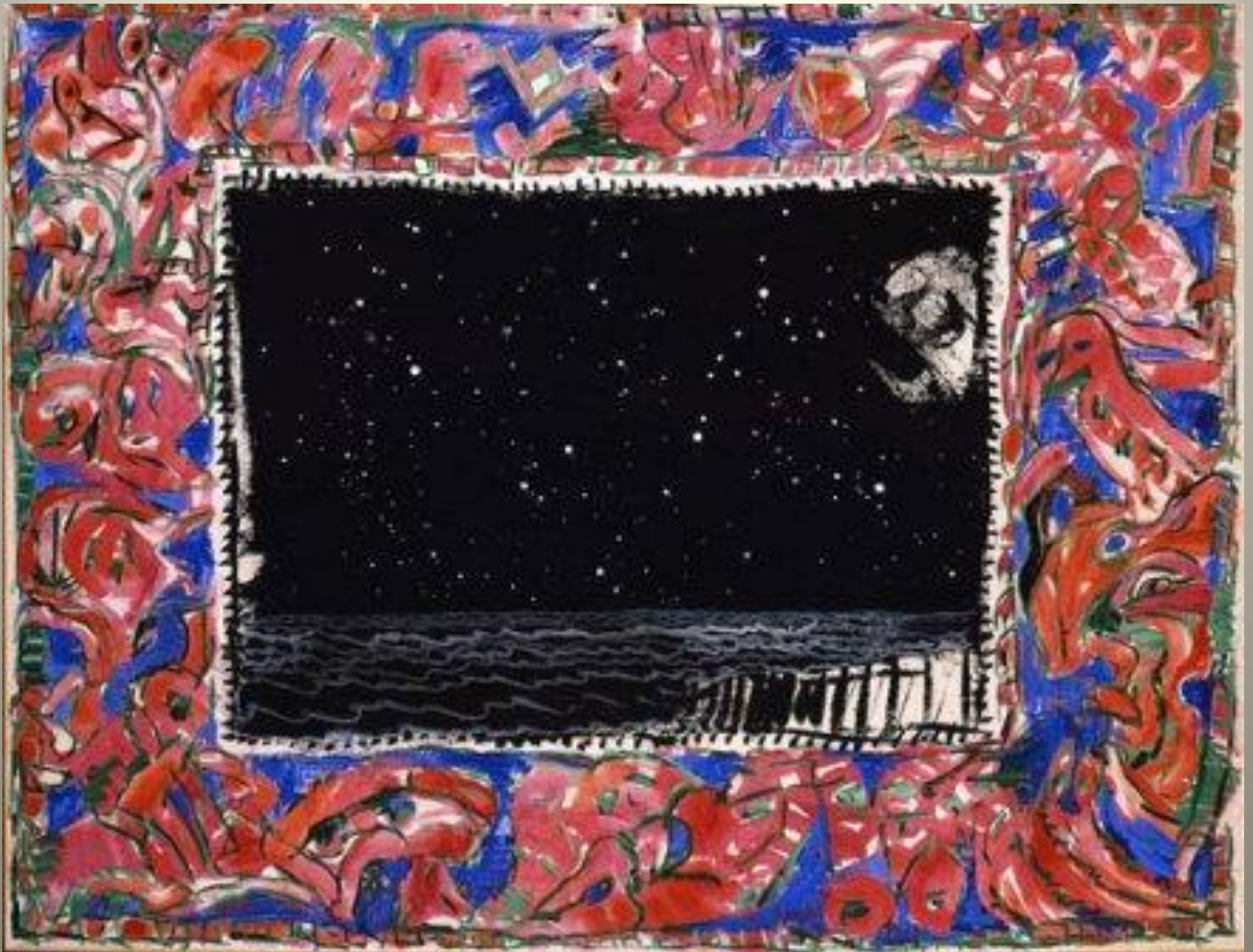
ALECHINSKY La mer noire 1990