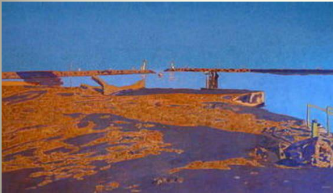
BIOULES Le port, le soir 1981