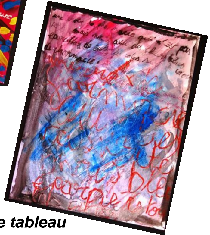
Les mots envahissent le tableau